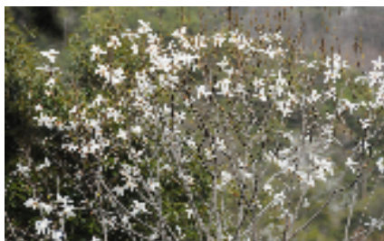
図1, コブシの花が美しく咲きました。 今年の春は、近隣の山々と芸術の夢 には全山コブシの白い花が一面に咲 き素晴らしい眺めです。1月~2月は 散策の道作りに精を出し、麓から山 の中腹までの道が完成しました。