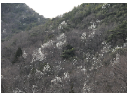
図3, 近郊の山々はコブシが一杯。 コブシが良く咲く年は、雨があまり 降らないと地元では言われています。